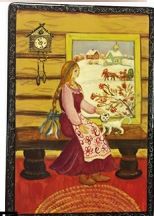
Иллюстрация: Валентина Куркина, работа студии «Арт-группа» в Санкт-Петербурге